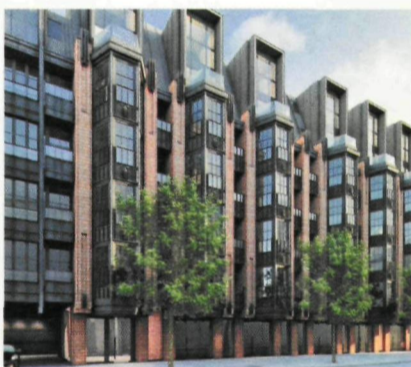
Family House wyróżnia ciekawa lokalizacja inwestycji, atrakcyjna cena i standardy wykończenia na najwyższym poziomie

Przyjęta strategia działania sprawia, że spółce udaje się połączyć wysoką klasę wykończenia z atrakcyjną ceną. Doceniają to klienci, bowiem deweloper nie może narzekać na brak zainteresowania swoimi projektami. W 2011 roku sprzedał już około 200 mieszkań.