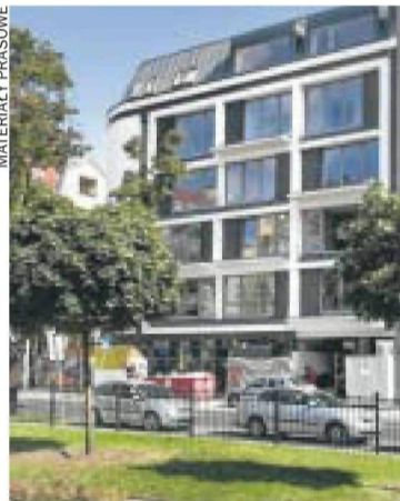
Kamienica Wildecka przy Chwałkowskiego

W kamienicy przy Kosińskiego 21 przy mieszkaniach na parterze będą tarasy i ogródki, z których będą mogli korzystać wyłącznie właściciele lokali