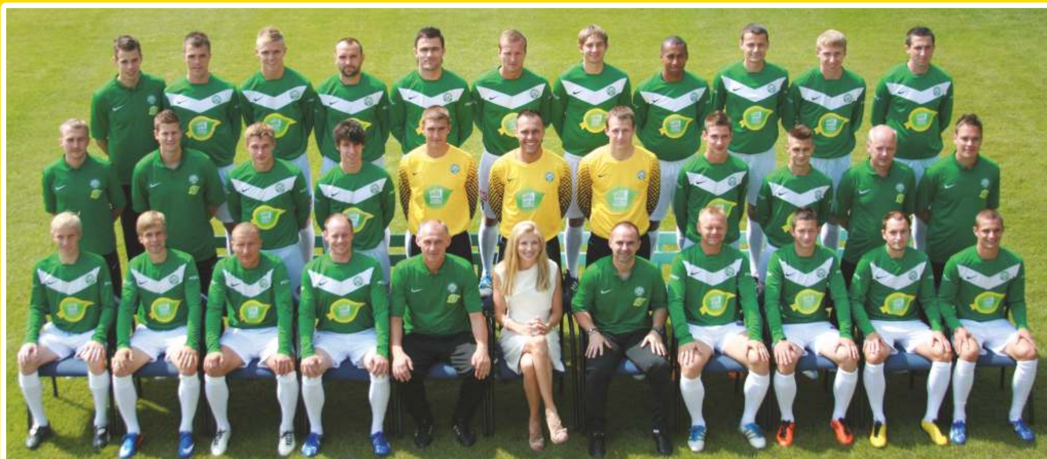
I Zespół KS Warta- lipiec 2011